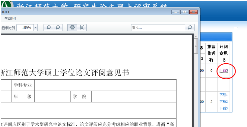
图 2.7-2 查看论文评阅意见书界面