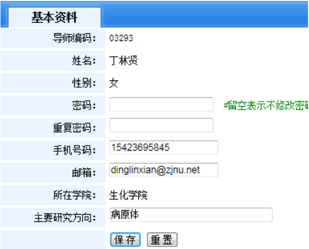
图 2.2-1 个人资料修改

点击左侧菜单的“修改个人资料”可以对当前登录账户的信息进行修改操作。可修改内容为：密码、手机号码、邮箱、主要研究方向。按照要求填写完资料后，保存就可以达到个人资料的修改。