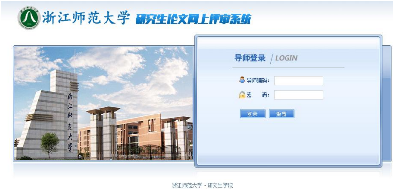
图 2.1-1 后台管理登录界面